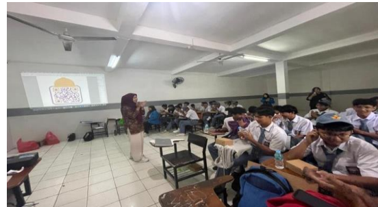
Gambar 1. Acara Pembukaan