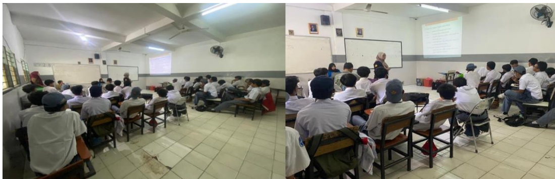
Gambar 2. Pemaparan Materi Dan Peragaan Alat Optic.